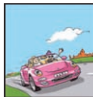
Page 17 UNE SACRÉE SURPRISE