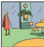
Page 7 LE RENDEZ-VOUS