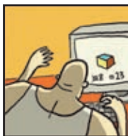
Page 15 LE TEST DE QI