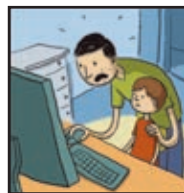
Page 9 PIÈGES À MÔMES