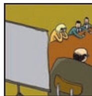
Page 11 L'HISTOIRE SANS FIN