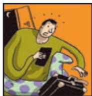
Page 5 JE SUIS ABSENT