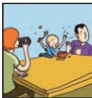
Page 21 SOUVENIRS NUMÉRIQUES