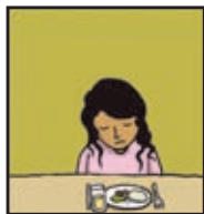
Page 19 LE PROBLÈME