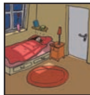
Page 23 ACCÈS NON SÉCURISÉ