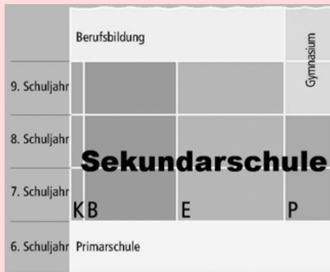
Die Sek I neu.

gessen wir auch nicht, dass eine kürzlich getätigte Umfrage der Universität Zürich aufgezeigt hat, dass 90 % der Schweizerinnen und Schweizer für unser Land ein einheitliches Bildungssystem wünschen. Auch in der solothurnischen Bevölkerung ist der Wille nach einer Harmonisierung im Bildungswesen mit den anderen Kantonen in hohem Masse spürbar. Und dieser Harmonisierungswillen bezieht sich auch ganz klar auf die Sekundarstufe I.