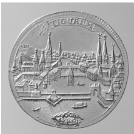
Historische Zürcher Goldmünze.

Die verschiedenen Einstellungen zum Geld stehen im Zentrum des zweiten, psychologischen Teils der Ausstellung. «Welcher Geldtyp bin ich?», heisst der Titel eines Tests, den die Besucherinnen und Besucher gleich in der Ausstellung an einer Bildschirmstation machen können. Ein weiterer Raum ist mit einem für die Ausstellung entworfenen, fünfteiligen Wandbild des aus der Graffiti-Szene stammenden Street-art-Künstlers Rodja Galli ausgestaltet. Auf Flachbildschirmen erscheinen «Dreissig dreiste Lügen über Geld». Die mit Karikaturen illustrierten «Lügen» wie «Schulden sind etwas Schlechtes» oder «Geld ist Freiheit» provozieren die Ausstellungsbesuchenden zu schriftlichen Stellungnahmen. Wie denken prominente Zeitgenossen über Geld? Welche Einstellung haben Schülerinnen und Schüler zum Geld? In dem mit