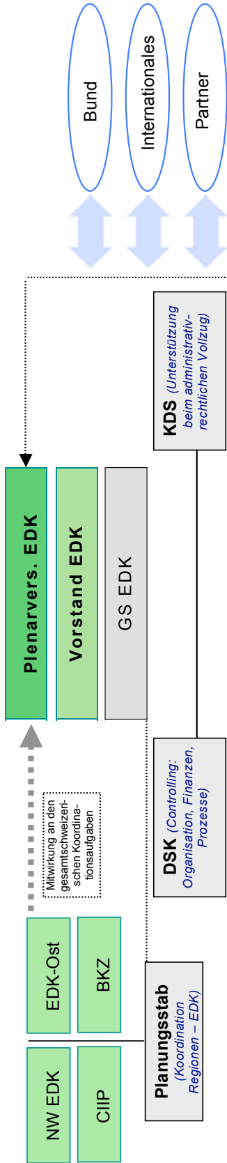
Die Gremienstruktur der EDK ab 1.1.2008