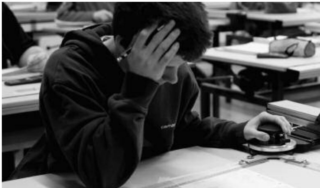
Ziel der Stützkurse ist es, die Kenntnisse und Fertigkeiten der Lernenden auf ein Niveau anzuheben, das ihnen erlaubt, dem regulären Unterricht im entsprechenden Fach ohne Probleme zu folgen.

Seit Jahren leisten die Stützkurse der berufsbildenden Schulen im Rahmen der Pädagogischen Fördermassnahmen (PFM) einen nicht zu unterschätzenden Beitrag zur schulischen Leistungsverbesserung vieler Lernender.