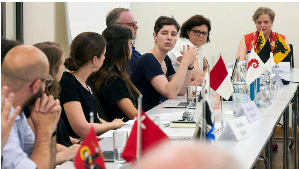
Durant une session de la Conférence intercantonale Citoyenneté

La Conférence intercantonale Citoyenneté (CiC), mise sur pied par la Fondation ch, permet aux cantons de partager leurs expériences dans le domaine de l'éducation à la citoyenneté et de mettre en lumière les approches les plus prometteuses. Les échanges entre représentantes et représentants cantonaux vont bon train.