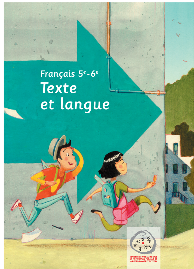
MER Français 5 e -6 e , Texte et langue

VD: Afin de donner des clés aux élèves dans la complexité alimentaire actuelle, un complément au plan d'études d'éducation nutritionnelle et un nouveau moyen d'enseignement sont mis en œuvre dès cette rentrée dans les classes du cycle 1. Ils seront ensuite progressivement introduits dans les années suivantes aux cycles 2 et 3. Par ailleurs, des actions concrètes visant la promotion de la lecture viennent s'ajouter aux nouveaux MER Français 1-8, afin de rendre la lecture plus attractive et accessible aux élèves: d'une part en déployant des ressources pédagogiques, d'autre part via des activités permettant d'éveiller le goût de la lecture chez les élèves. Entre autres actions, le canton a réalisé et édité le livre Mes premiers pas en lecture , qui accompagne depuis 2021 les élèves de 3 e année dans cet apprentissage essentiel et dont les échos du terrain font part d'une bonne adéquation à cette fin. Par ailleurs, l'introduction du nouveau MER Mathématiques 1-8 et de celui actualisé pour le cycle 3 se poursuit en 8 e et 9 e années. Au cycle 3, le projet vaudois Mathilda visant l'encouragement des filles à se former dans les domaines scientifiques, entre dans une phase de généralisation après quelques années de projet pilote à l'échelle régionale. De ce concept est née la petite sœur mini-Mathilda, destinée aux filles de 8 e année et promouvant la démarche scientifique.