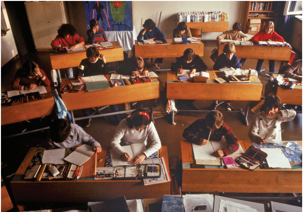
In den 1980er-Jahren waren Schulzimmer sehr gut ausgestattet und die Lehrpersonen gaben eine zunehmende Zahl von Hektografien und Fotokopien ab. Klassenzimmer im Schulhaus Felsberg, Luzern, 1982

Die unentgeltliche Schulpflicht an einer öffentlichen, vom Staat getragenen Schule, ist dafür eine zentrale Säule.