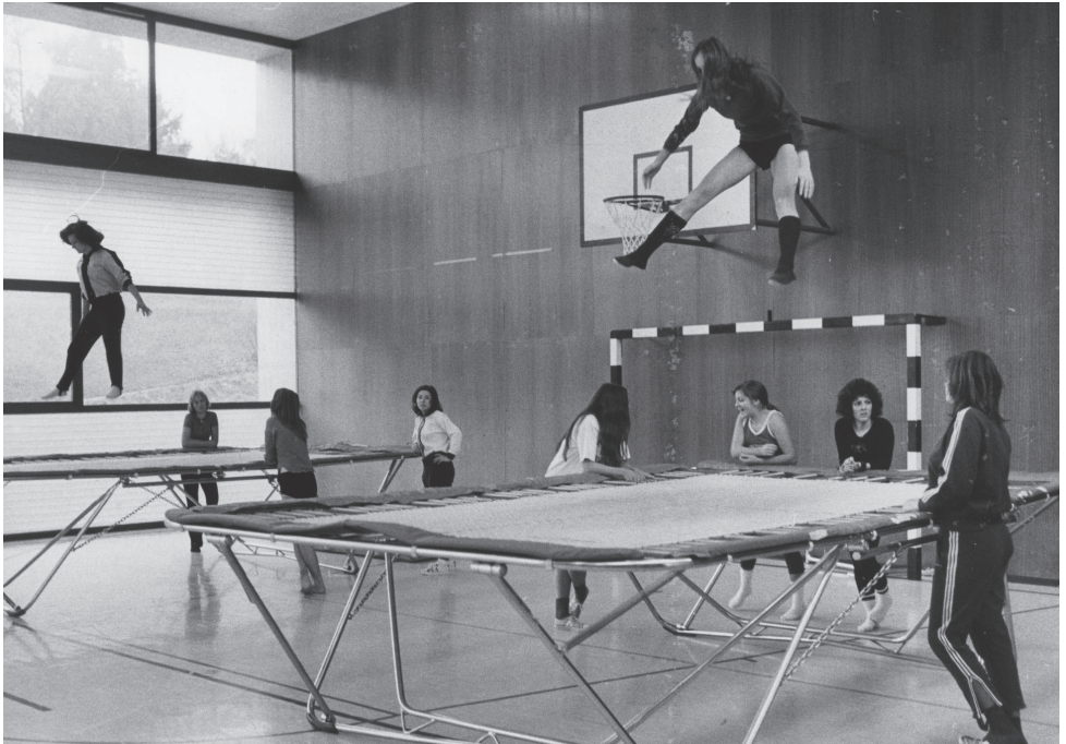
Seit den 1960er-Jahren besuchten immer mehr Schülerinnen die Luzerner Kantonsschulen. Turnunterricht an der Kantonsschule Alpenquai Luzern, 1974.

Und er ergreift Massnahmen: So werden zum Beispiel Vorbereitungskurse in zeitlicher Nähe zur Rekrutenschule eingeführt und für obligatorisch erklärt (Crotti & Kellerhals, 2007), und die Ergebnisse der Rekrutenprüfungen werden genau analysiert, heruntergebrochen auf einzelne Gemeinden.