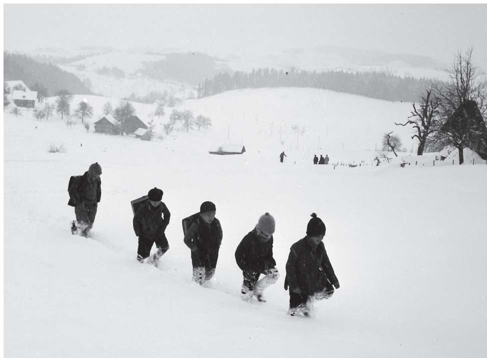
Romooser Schulkinder auf dem beschwerlichen und langen Fussweg zur Schule, Winter 1939 // Institut für Volkskunde, Basel, Sammlung Ernst Brunner, Schweiz, BN 68. Foto: Ernst Brunner, Herbst 1939.

Die Norm wird immer kleiner. Lehrpersonen haben extrem hohe Ansprüche an sich selbst und wollen Kinder bestmöglich fördern - das kann auch dazu führen, dass schneller nach Spezialisten gerufen wird und die Verantwortung gern abgeben wird.