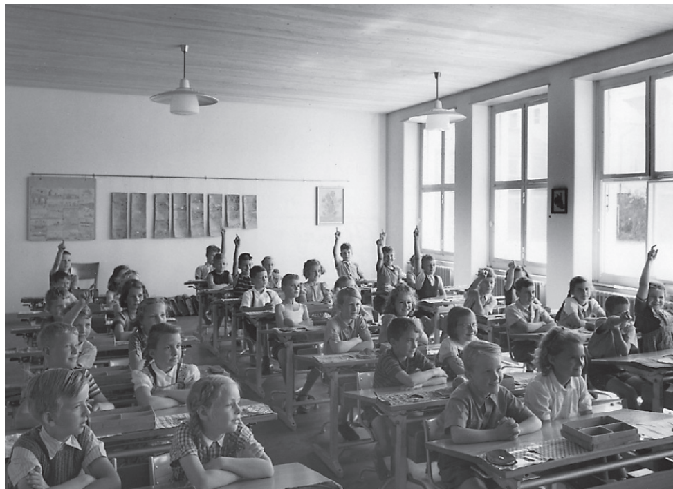
Der Frontalunterricht ab Mitte des 19. Jahrhunderts erlaubte es, die Tätigkeit aller Lernenden zu überwachen sowie Ablenkung und Müßiggang zu unterbinden.