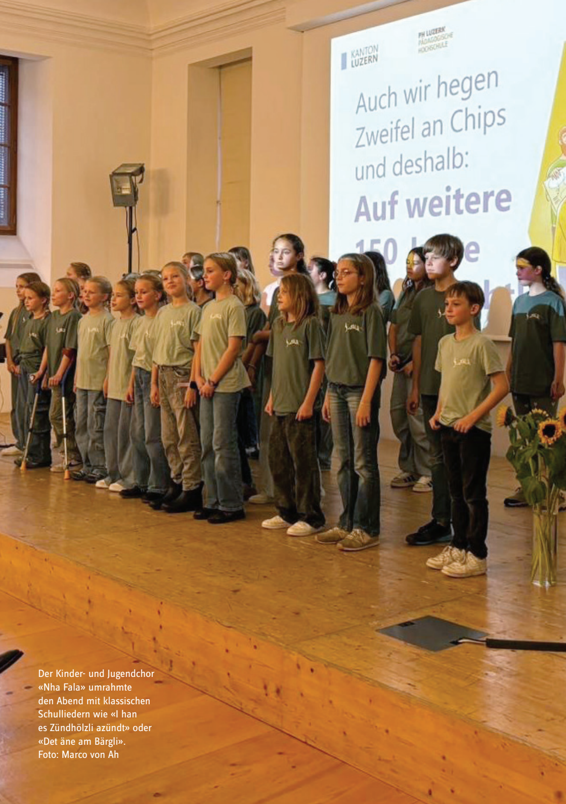
Der Kinder- und Jugendchor «Nha Fala» umrahmte den Abend mit klassischen Schulliedern wie «I han es Zündhölzli azündt» oder «Det äne am Bärgli».