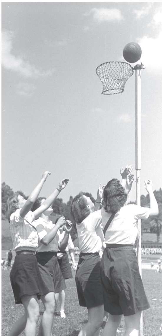
Jugendsporttag städt. Schulen auf der Luzerner Allmend

Dr. Armin Hartmann Regierungsrat Bildungs- und Kulturdepartement