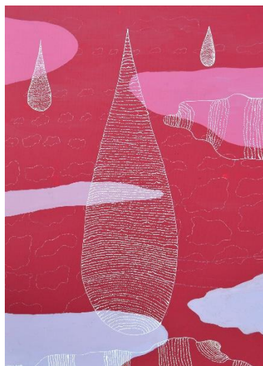
Figure 2 : Œuvre de Perrine Lapouille, acrylique sur toile, Céleste, 2019