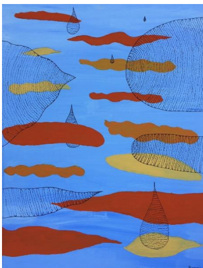
Figure 1 : Œuvre de Perrine Lapouille, acrylique sur toile, sans titre, 2017