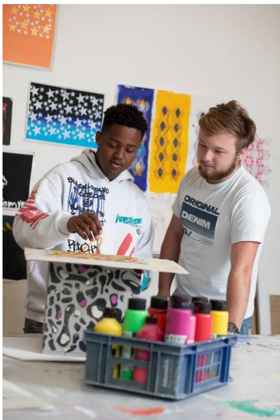
Vivre sa créativité dans le cadre du semestre de motivation à Bienne

Préapprentissage : 80 %, année préc. 75 % APP : 68 %, année précédente 64 % SEMO : 64 %, année précédente 68 %