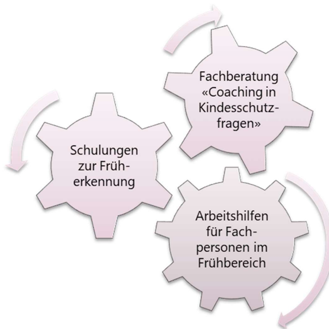
Abbildung 3: Massnahmen zur Stärkung des umfassenden Kindesschutzes im Frühbereich im Kanton Bern (eigene Darstellung)

Im Rahmen des Projekts «Früherkennung im Frühbereich» hat das Kantonale Jugendamt in den vergangenen zehn Jahren in enger Zusammenarbeit mit der Mütter- und Väterberatung des Kantons Bern, der Berner Fachhochschule (BFH) für Soziale Arbeit und weiteren Partnern verschiedene Unterstützungsangebote entwickelt. Dazu zählen fachliche Grundlagen (Arbeitshilfen), Schulungen und fachspezifische Beratungen (Coachings), welche von verschiedenen Berufsgruppen im Frühbereich genutzt werden können (vgl. Abb. 3).