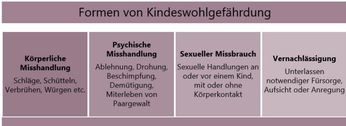
Abbildung 1: Formen von Kindeswohlgefährdung (eigene Darstellung)

Eine Gefährdung des Kindeswohls besteht, wenn die Grundbedürfnisse und Grundrechte des Kindes nicht erfüllt sind, das Kind sich nicht seinen Potenzialen entsprechend entfalten kann und vermeidbares Leid nicht verhindert wird (Hauri & Zingaro, 2020). Die verschiedenen Gefährdungsformen sind in Abbildung 1 dargestellt (Kantonales Jugendamt, 2020b).