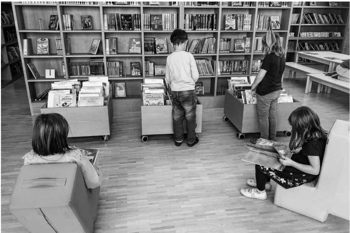
Schulbibliothek Mörschwil 2021

Das Volksschulgesetz des Kantons St.Gallen legt fest, dass «jede Schule eine Bibliothek für Schülerinnen und Schüler sowie eine Bibliothek für Lehrpersonen unterhalten oder gemeinsam mit anderen Institutionen führen muss» (sGS 213.1 – Volksschulgesetz [abgekürzt VSG], Art. 25 Bibliothek). Diese Weiterbildung will Verantwortliche von Schulbibliotheken in ihren Aufgaben unterstützen.