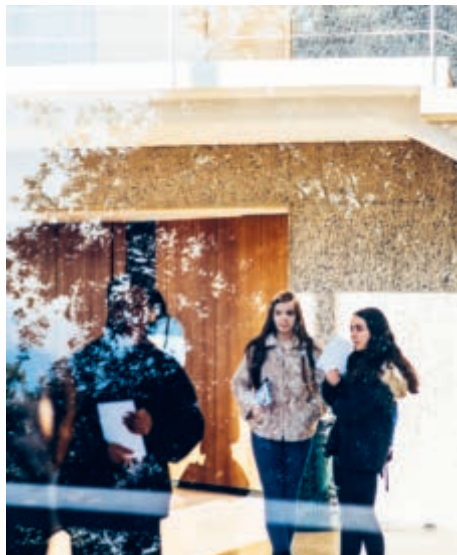
Rentrée 2019 : L'emblématique Aula des Cèdres renoue avec son public étudiant après une rénovation réalisée avec le plus grand soin par l'architecte Ivan Kolecek.

Parce que les apprentissages fondamentaux sont également déterminants au sein d'une école fondée sur l'égalité des chances, la HEP Vaud renforce la formation de celles et ceux qui se destinent à enseigner dans les premiers degrés de la scolarité. C'est animée du même esprit que la Haute école développe les compétences de ses futures enseignantes et futurs enseignants pour les familiariser avec des contextes multiculturels et plurilinguistiques et les sensibiliser à une transmission non genrée du savoir.