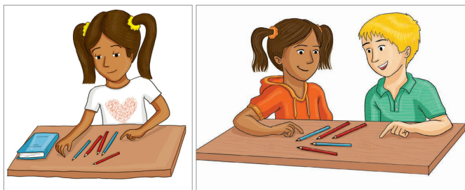
Évolution des illustrations relative à la résolution de problèmes. Celle-ci ne concerne pas que les filles (image de gauche initiale), mais également les garçons (image finale à droite) (MER Mathématiques 3 e , 2019).

Le MER Mathématiques de 3 e année a par exemple fait l'objet d'une relecture finale fine visant à rectifier d'éventuels déséquilibres au niveau de la représentativité des genres ou de la diversité culturelle. Des rééquilibrages ont ainsi pu être réalisés sur différents aspects, comme par exemple le choix des prénoms des personnages