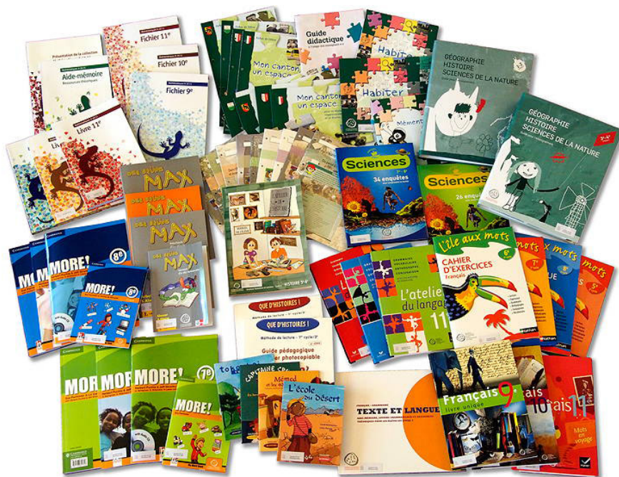
Ensemble des MER à disposition des cantons de Suisse romande – 2018

Le ballon de Manon et la corde à sauter de Noé ; Nanjoud, Ducret, 2 e Observatoire 2018