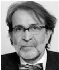
Von Theo Wehner

Formen des Problem-based Learning (pbl) halten in der Sekundarstufe II Einzug. Eine Tagung Mitte Juni erlaubte eine vertiefte Auseinandersetzung mit dem Konzept. Es zeigte sich, dass pbl-Ansätze eigentlich strategisch, zumindest aber curricular in den Lehrinstitutionen fest verankert und nicht zur Auflockerung der Lernenden eingesetzt werden sollten. Die Tagung förderte zudem durchaus Gemeinsamkeiten mit der konkurrierenden Lehrmethode zutage, der instruktionistischen Wissensvermittlung. Eine Tagungsphänographie. 1