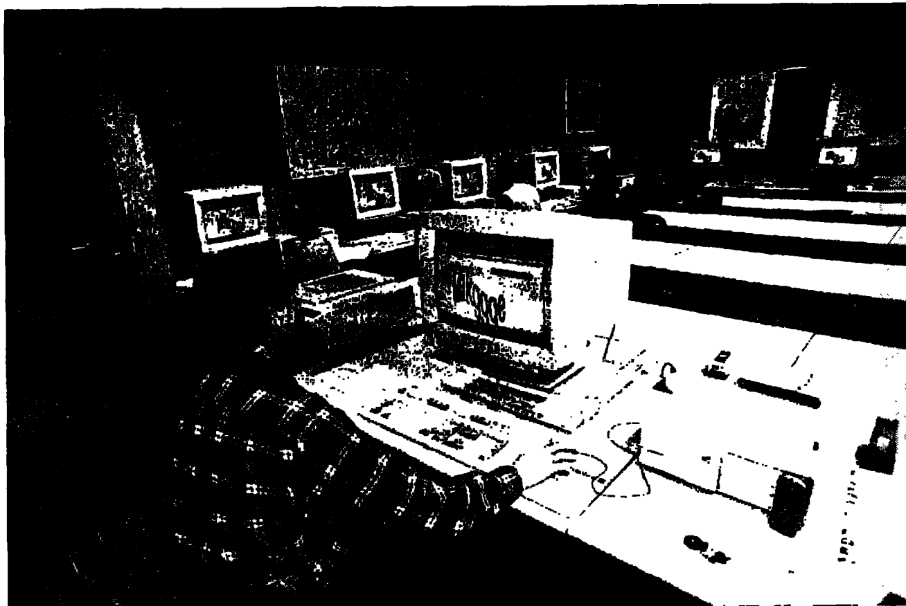
Der Bundesrat soll einen Systemwechsel bei der Finanzierung der Weiterbildung prüfen.

Ständerat wandelt Solothurner Initiative zur Weiterbildungsfinanzierung in Postulat um