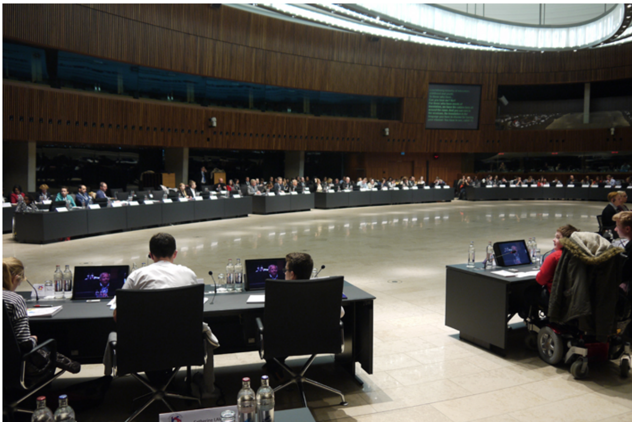
Abbildung 2: Junge Delegierte und andere Vertreter bei dem Europäischen Hearing

zusammengefasst und bilden die Grundlage der Luxemburger Empfehlungen . Die Empfehlungen zielen darauf ab, die Implementierung inklusiver Bildung als beste Option zu unterstützen, wo die dafür notwendigen Bedingungen vorhanden sind. Die Empfehlungen ordnen sich rund um fünf wichtige Botschaften an, die die Jugendlichen bei ihren Diskussionen und der Präsentation der Ergebnisse zum Ausdruck brachten.