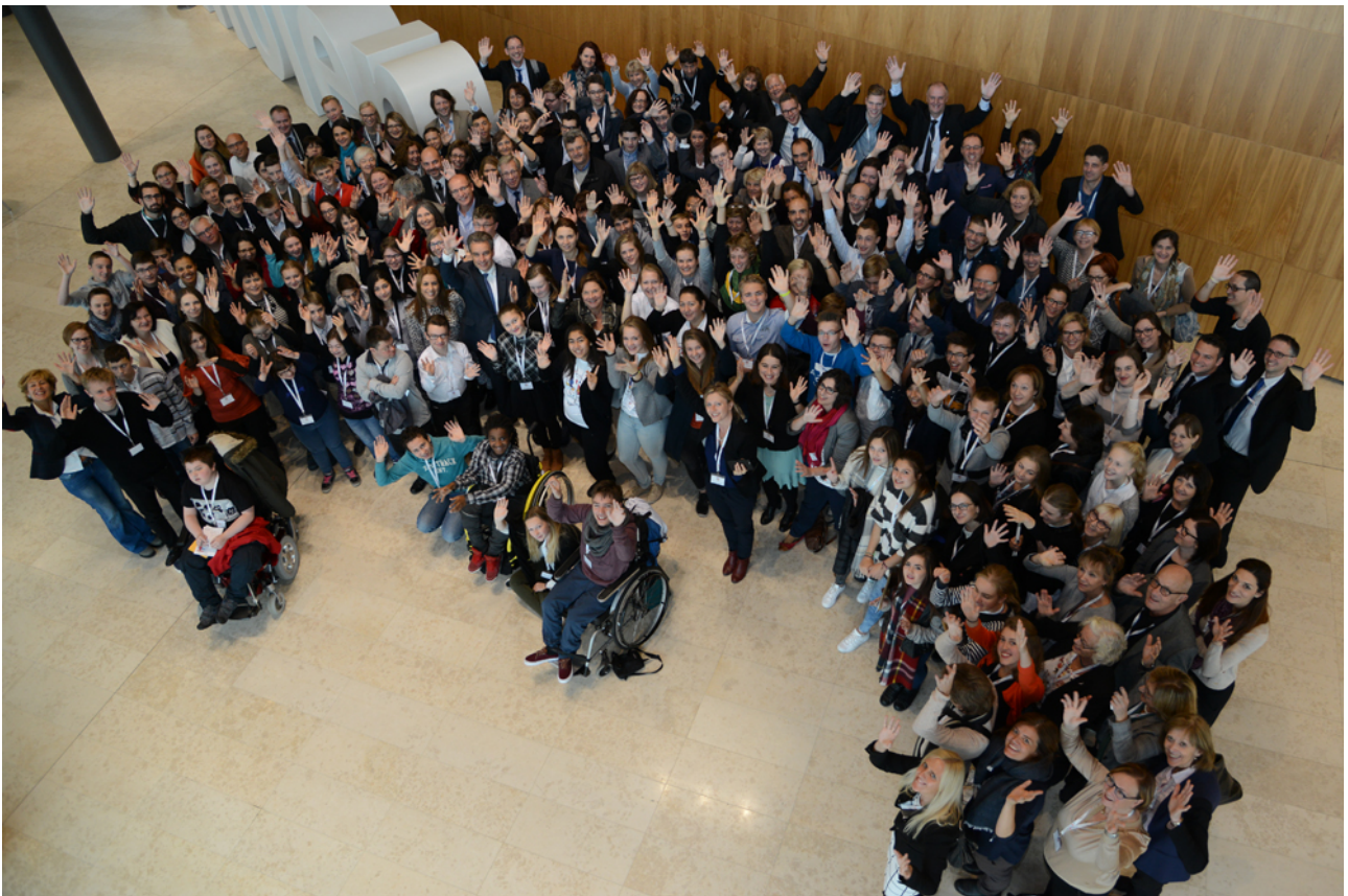
Abbildung 5: Teilnehmer des Europäischen Hearings

Die Luxemburger Empfehlungen wurden im Rahmen der Konferenz „Bildung, Jugend, Kultur und Sport“ am 23. November 2015 dem Ministerrat und am 2.–3. Dezember 2015 dem Bildungsausschuss zur Kenntnisnahme und zur Berücksichtigung als Basis für mögliche weitere Maßnahmen vorgestellt.