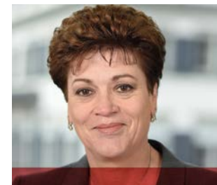
La presidente della CDPE è la consigliera di Stato Silvia Steiner (ZH)

I Cantoni concordatari istituiscono un ente intercantionale di diritto pubblico per il promovimento delle strutture scolastiche e per la coordinazione delle rispettive legislazioni cantonali.