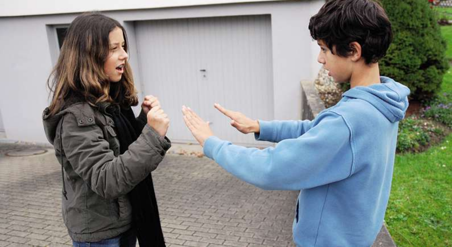
Grenzen erkennen, Grenzen respektieren, Grenzen setzen: Das sind Hauptthemen in der Gewaltprävention.