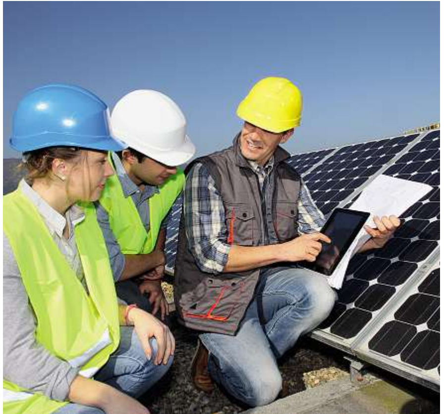
Die Fachhochschule Nordwestschweiz investiert in MINT-Disziplinen.

Die FDP-Fraktion wollte am 15. Januar mittels einer Interpellation wissen, wie die MINT-Disziplinen an der Fachhochschule Nordwestschweiz (FHNW) seit 2009 gefördert werden. Anlass für die Interpellation war der anhaltende Fachkräftemangel in verschiedenen MINT-Bereichen. Nun liegt die regierungsrätliche Antwort vor: Die vier im MINT-Bereich aktiven Hochschulen (FHNW: Hochschule für Architektur, Bau und Geomatik, Hochschule für Life Sciences, Pädagogische Hochschule, Hochschule für Technik) böten Bachelor- und Masterstudiengänge respektive spezifische Module in den MINT-Bereichen an – alle Aktivitäten zum Ausbau und zur Entwicklung dieser Studieninhalte dienen auch der MINT-Förderung. Seit Herbst 2011 würde an der Hochschule für Technik FHNW ausserdem ein zusätzlicher, neu entwickelter Studiengang angeboten (Bachelor in Energie- und Umwelttechnik). Die vier Hochschulen der FHNW hätten zahlreiche Anstrengungen zur Förderung der MINT-Kompetenzen unternommen, schreibt der Regierungsrat und listet