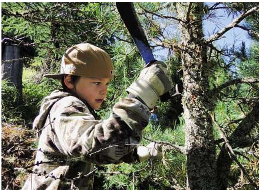
Im Bergwaldprojekt kommen Kinder der Natur nahe wie hier in Valchava.