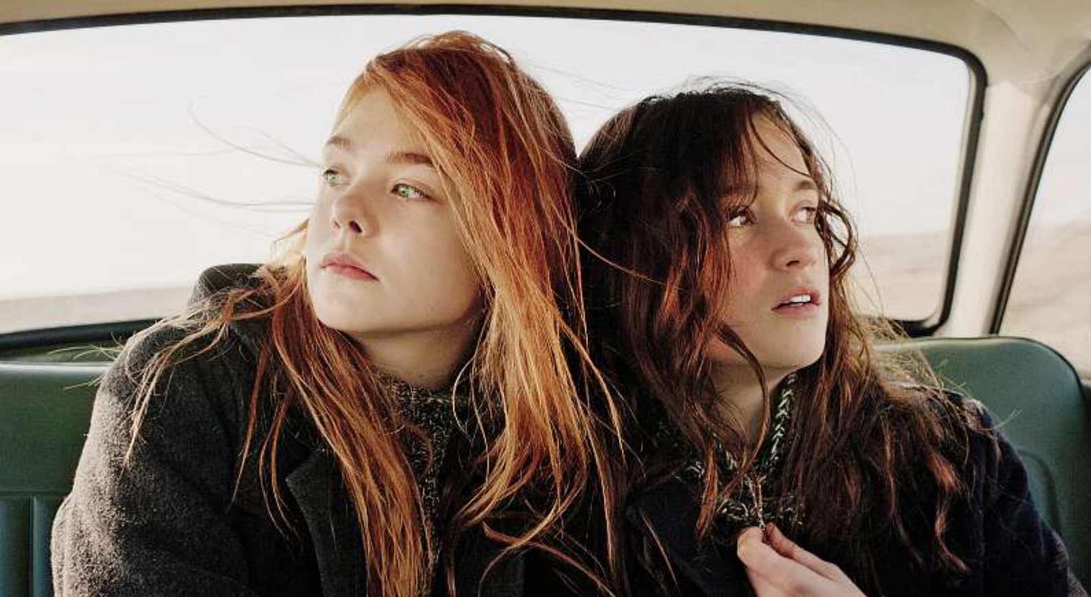
Ginger und Rosa: Freundinnen im Guten wie im Schlechten.