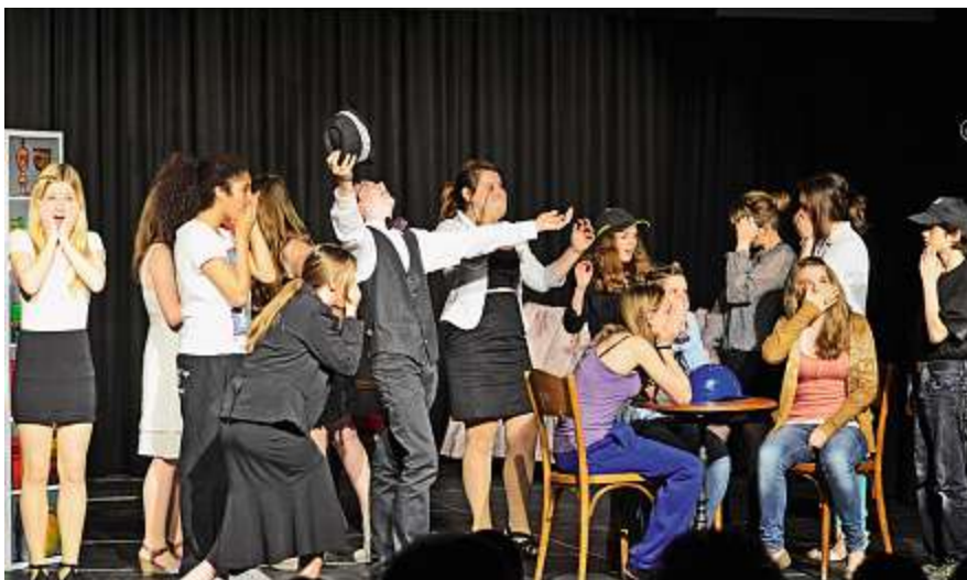
Die Bezirksschule Bremgarten führte 2012 den «Revisor» auf.

(ergänzt mit einer Bildinfo) und einem Kastentext, in dem die wichtigsten Eckdaten des Projektes zusammengefasst sind, veröffentlicht das SCHULBLATT vielleicht eine Seite zu Ihrem Projekt im «Praxis»-Teil. Machen Sie mit! Text (möglichst ungestaltetes Word-Dokument) und Bild an: schulblatt@alv-ag.ch . Redaktionsschlüsse sind einsehbar unter www.alv-ag.ch → SCHULBLATT → Daten. Irene Schertenleib