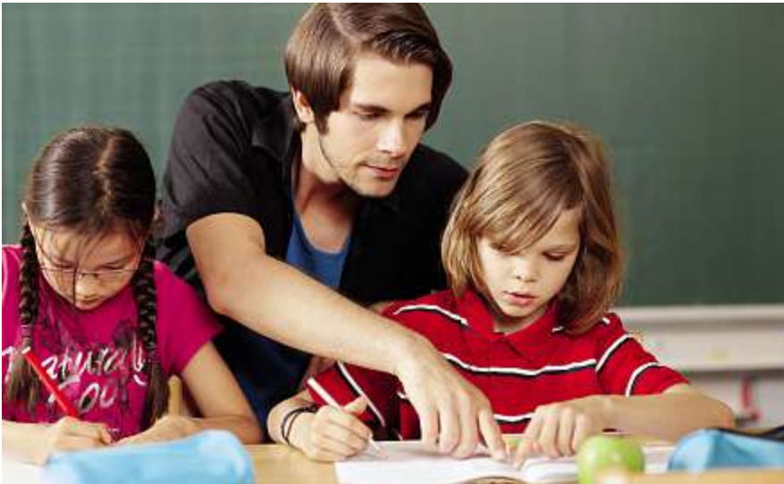
Der Schlussbericht des Schulversuchs soll dem Regierungsrat zur Festlegung der definitiven Ausgestaltung der Speziellen Förderung dienen.