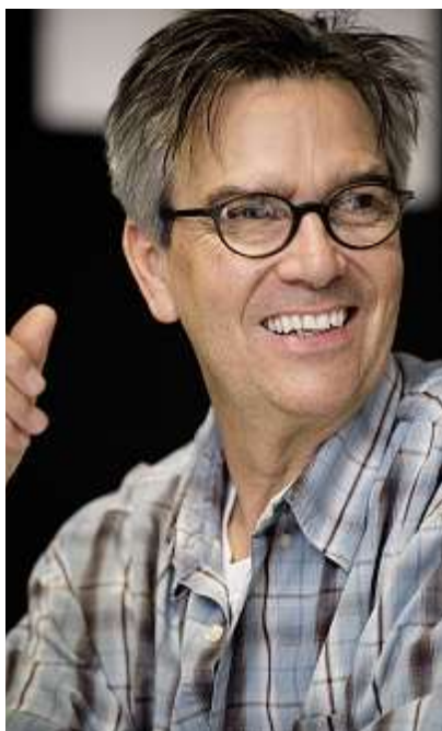
Ruedi Häusermann.

Im Rahmen der Kolloquiums- und Konzertreihe «Musik & Mensch» der Fachhochschule Nordwestschweiz FHNW finden folgende Kolloquien statt: «Begegnung mit Ruedi Häusermann»: Kolloquium mit Ruedi Häusermann und Thomas Meyer, Musikwissenschaftler und freier Journalist; «Students in Concert»: Konzert mit verschiedenen Ensembles von Studierenden der FHNW. Weitere Informationen zur ganzen Reihe «Musik & Mensch» unter www.fhnw.ch/ph/musikundmensch .