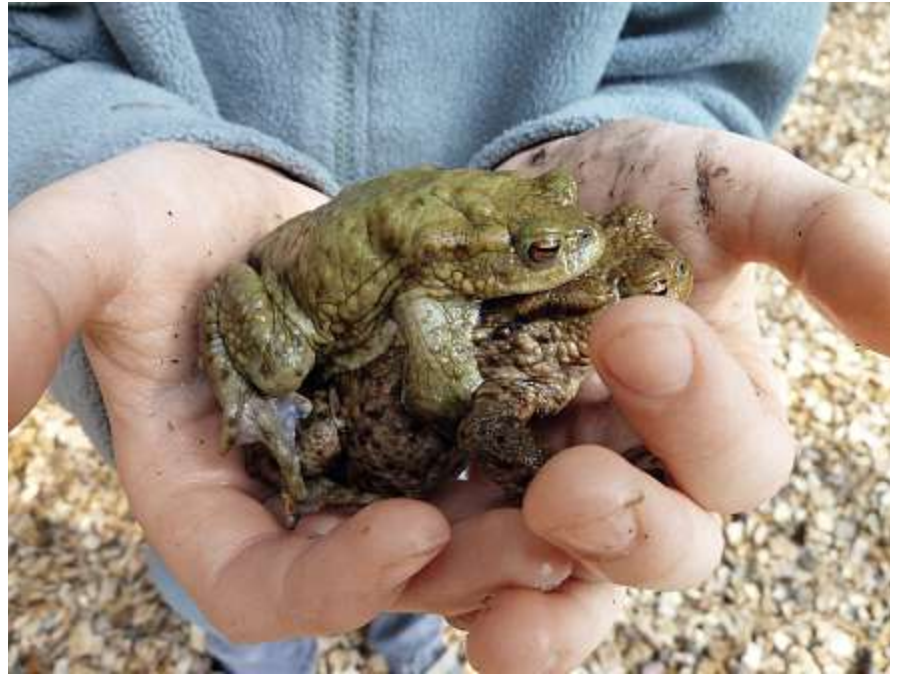
Authentische Begegnung mit einem Erdkrötenpaar.

Die neu entwickelte Amphibienkiste enthält ausgewählte und bewährte Medien