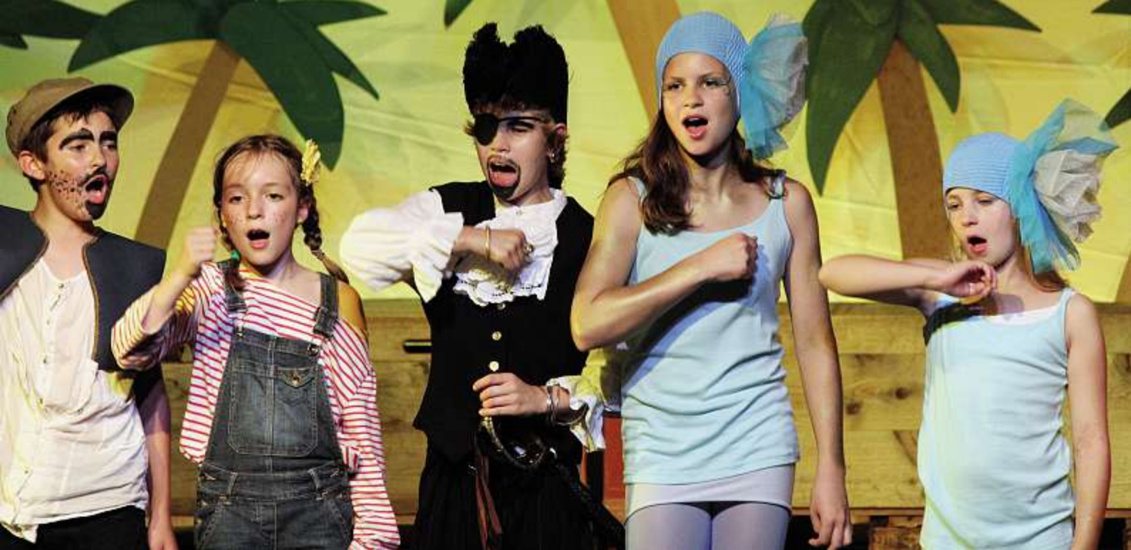
Die Musikband «Silberbüx» komponierte und konzipierte das Musiktheater «AHOI» für 270 Badener Kinder.