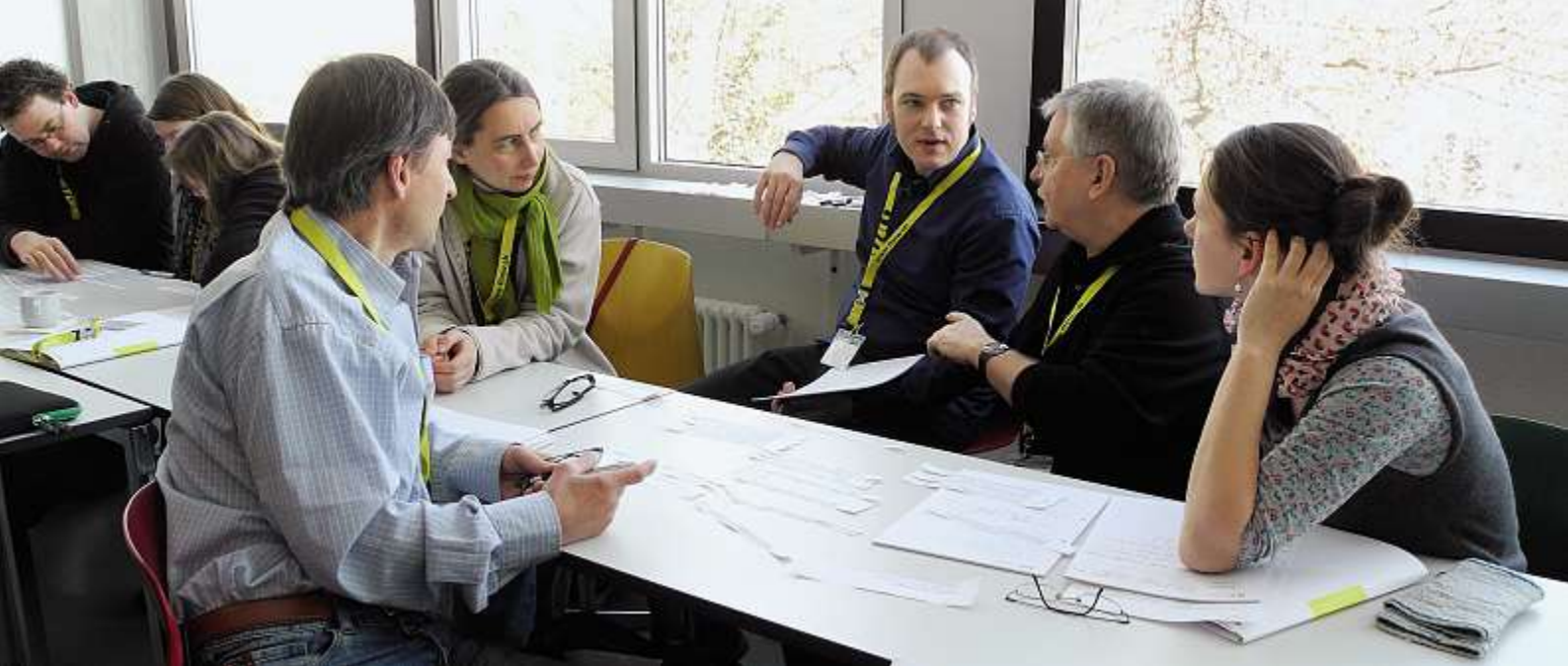
Über 50 Teilnehmende aus der Schweiz, Deutschland und Österreich beschäftigten sich mit aktuellen Fragen im Bereich innovativer Lehre.