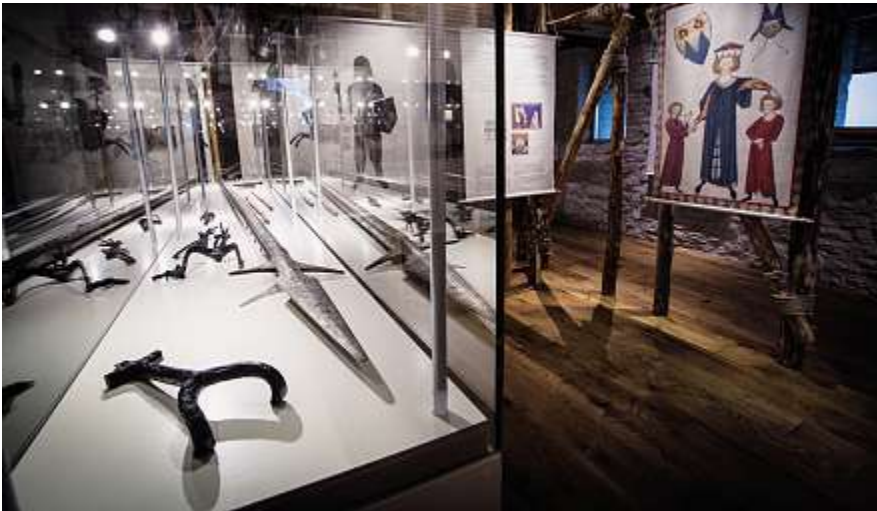
In der Ritterausstellung erfahren Schulklassen was zur Ausbildung eines Ritters gehörte.