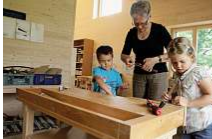
Die «BeratungsWERKstatt» berät bei der Einrichtung von Arbeitsplätzen.

Holz bietet durch die unterschiedlichen Erscheinungsformen, seine optischen und haptischen Eigenschaften viele Anreize für Materialerkundungen, für handwerkliche Vorhaben und gestalterische Ideen. Seine Bearbeitung verlangt Kraft, Geschick und gutes Werkzeug. Sägen, Bohren, Nageln, Schleifen – die Bearbeitung des «handfesten» Materials, der Umgang mit anspruchsvollen und kraftfordernden Werkzeugen fasziniert Jungen und Mädchen. Sie können dabei manuelle und technische Fähigkeiten entwickeln. Anregende Werkplätze zur Holzbearbeitung lassen sich in jedem Kindergarten mit wenig organisatorischem und finanziellem Aufwand einrichten. Fachgerechte Instruktionen und Regelungen zur Hand-