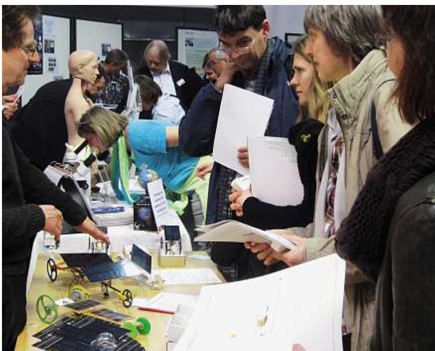
Die Teilnehmenden des «SWiSE»-Innovationstags stöbern am «Markt» in Unterrichtsmaterialien.

Weitere Informationen unter www.swise.ch/innovationstag.cfm .