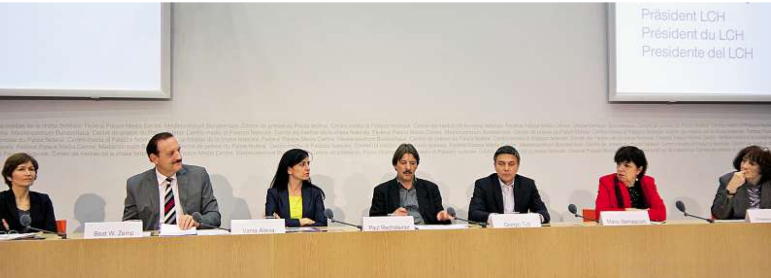
Breit abgestützt: Die Vorstellung der Initiative AHVplus am 11. März im Medienzentrum des Bundeshauses.