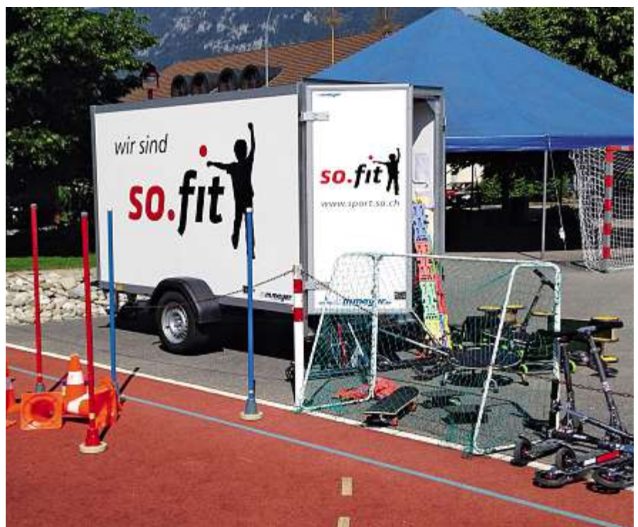
Der so.fit-Bewegungsanhänger erweitert Ihr Bewegungsangebot.