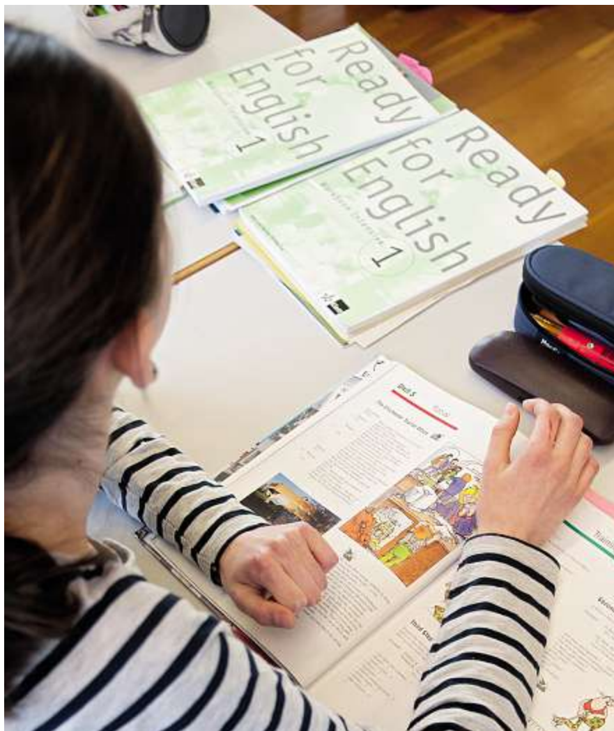
Ready for English? Sprachunterricht in der 7. Klasse in Biberist.

Die Lernenden kommen mit vielen Sprachkenntnissen in den Unterricht, aber diese sind oft unstrukturiert und vieles wird unbewusst angewendet. Einig sind sich alle Lehrpersonen, dass im Unterricht an der Oberstufe das Schreiben und die Grammatik eine grössere Bedeutung erhalten. Struktur und Ordnung sollen den Schülerinnen und Schülern vermehrt beim Lernen helfen. Wichtig ist immer, dass dabei Erfolgserlebnisse möglich sind und dass die Freude am Lernen nicht verloren geht. Esther Erne, Präsidentin SLA