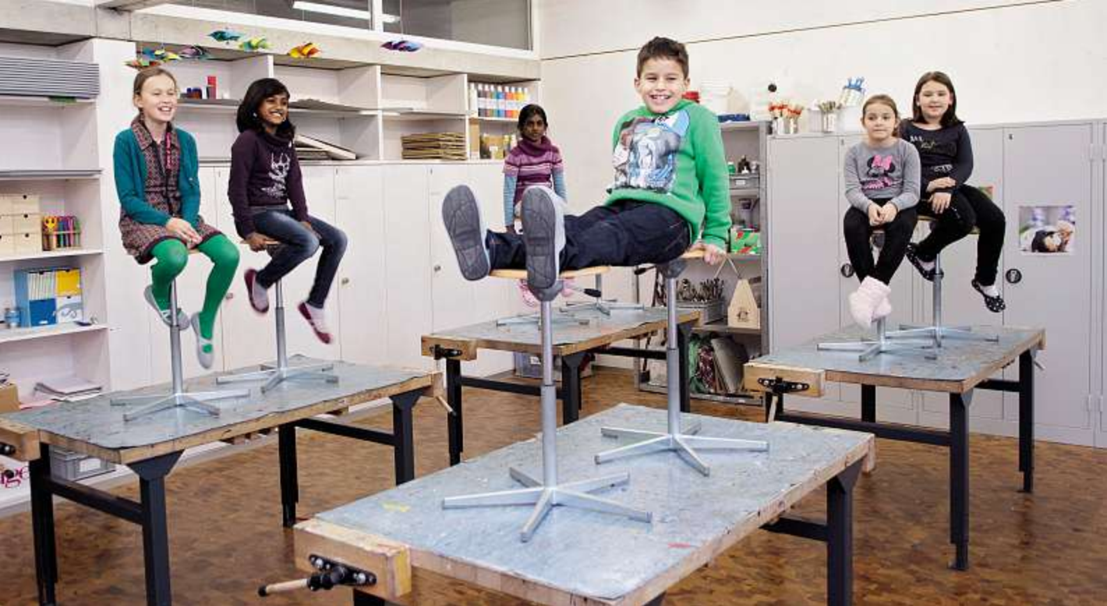
Jahresthema «schulische Disziplin»: Klare Forderungen stellen heisst nicht, den Humor zu verlieren.