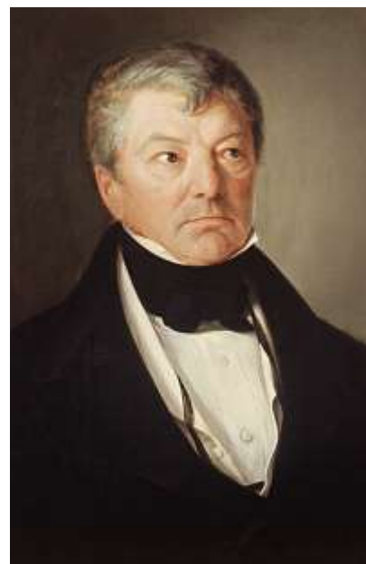
Heinrich Zschokke (Teil eines Doppelporträts), 1842 gemalt von Julius Schrader (Stadtmuseum Schöslisli).

Der aus Magdeburg stammende Volksaufklärer Heinrich Zschokke (1771–1848) ist ausserhalb des Kantons Aargau beinahe in Vergessenheit geraten. Als Politiker und Publizist trat er für eine liberale Staatsverfassung und für Pressefreiheit ein und spielte eine bedeutende Rolle als Wegbereiter der modernen Schweiz. Das Forum Schlossplatz und das Stadtmuseum Aarau widmen ihm eine Ausstellung mit Gegenwartsbezug. Informationen: www.forumschlossplatz.ch .