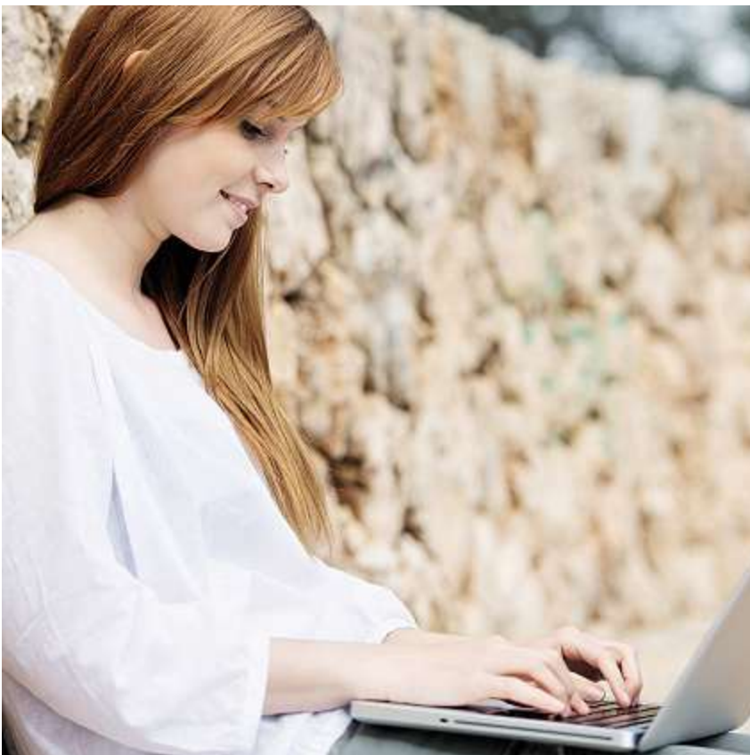
Der Schreibwettbewerb ermuntert Jugendliche, über Mobilität und Austausch zu schreiben.

Kein Seminar in Ihrer Nähe? Ganz einfach! Beantragen Sie ein Seminar für das Kollegium an Ihrer Schule unter www.innovativeschools.ch .