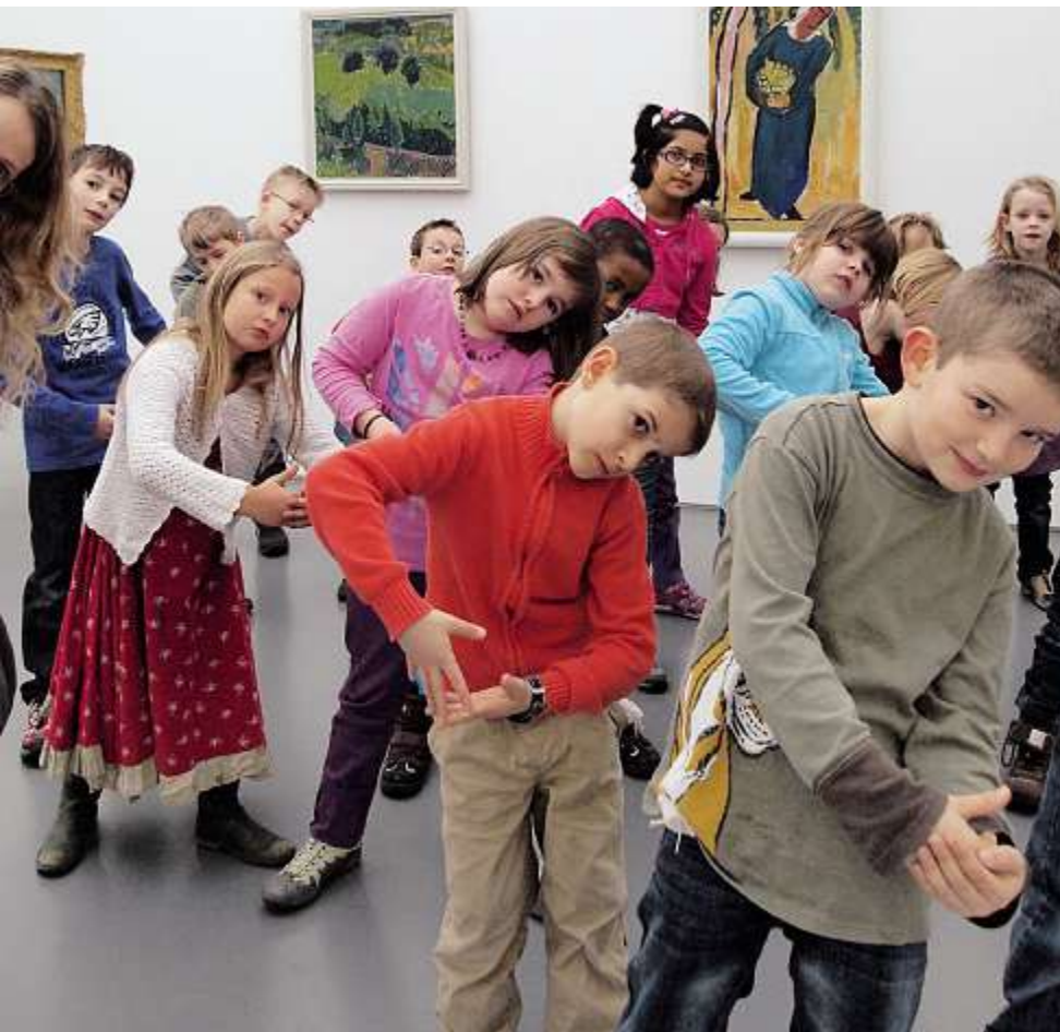
Schülerinnen und Schüler stellen ein Werk aus der Sammlung nach.