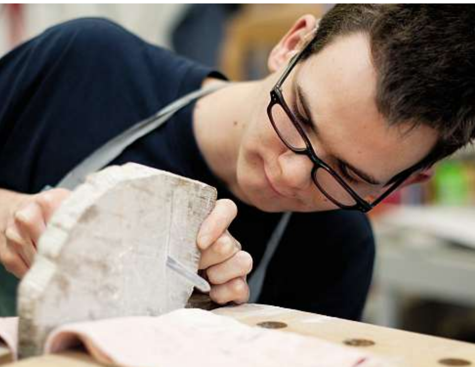
Dass die Volksschule eine Schule für alle Kinder ist, ergibt sich aus der Entwicklung der Geschichte der Sonderpädagogik.