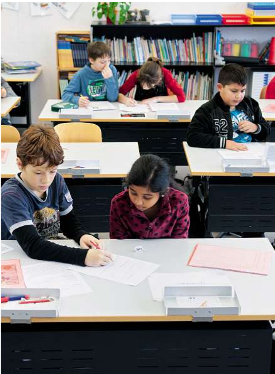
Wie gross ist die Berufszufriedenheit von Lehrpersonen?