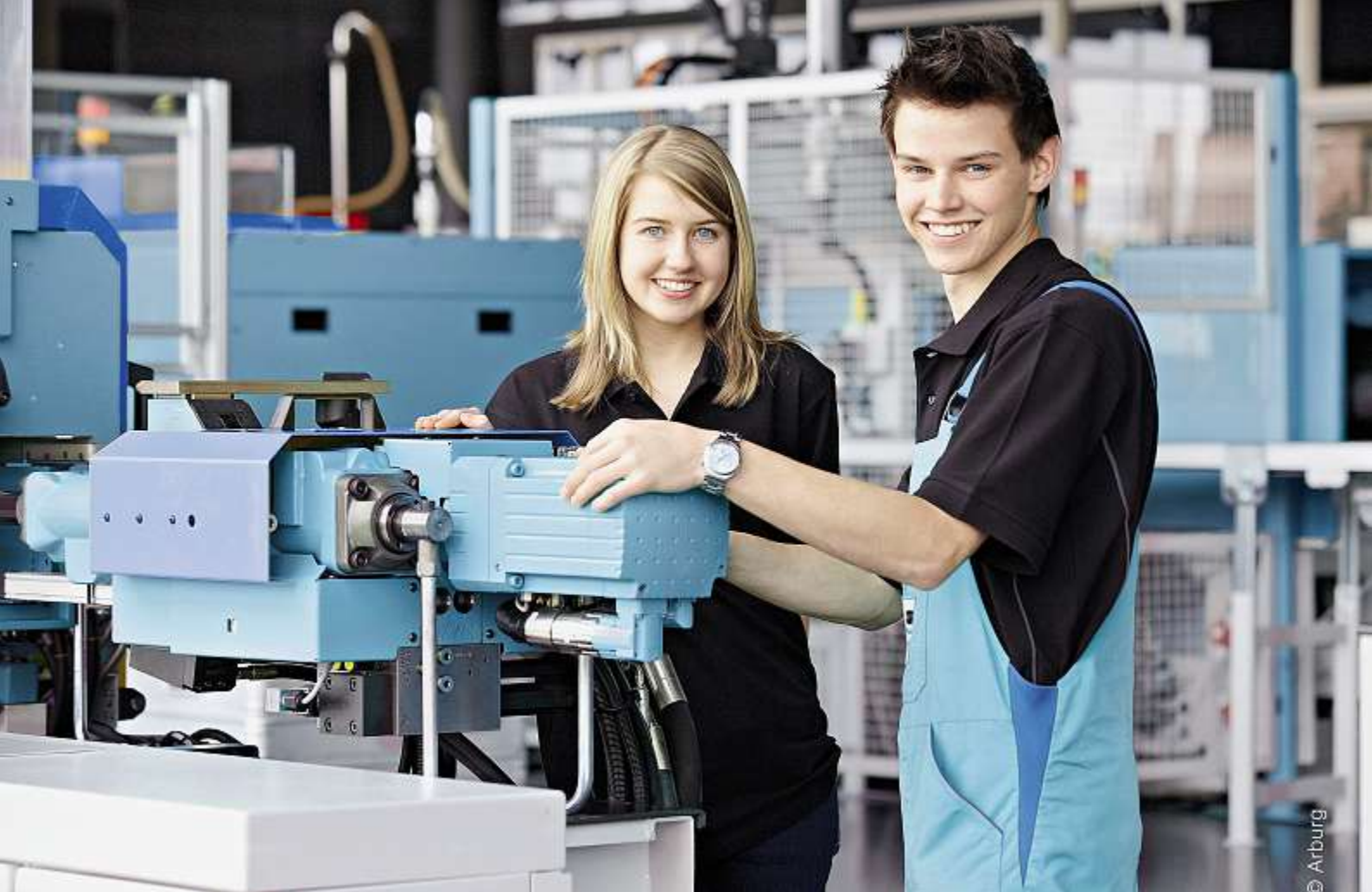
An der IBLive 2013 selber Hand anlegen.