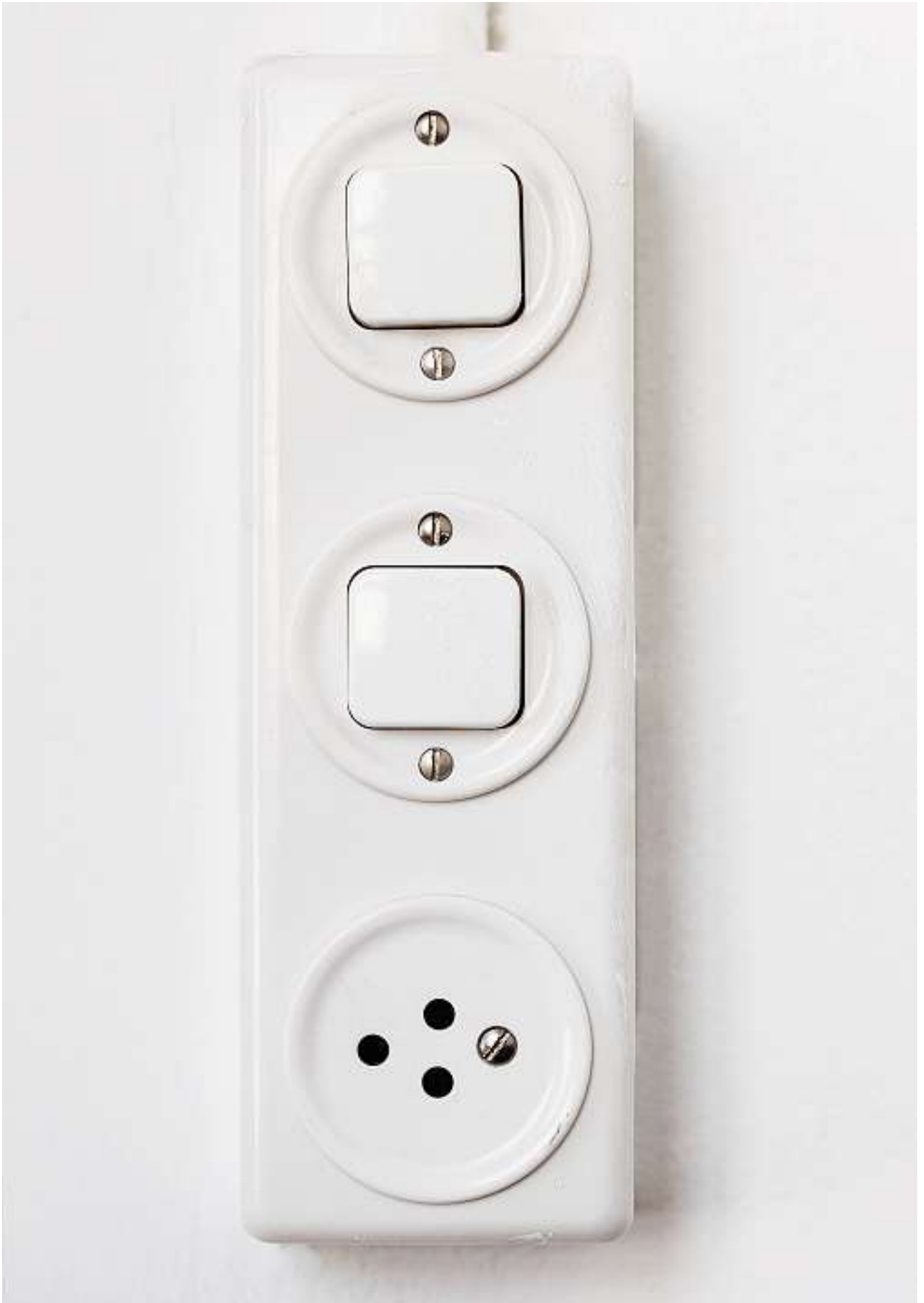
So etwas lässt kein Berufsbildner durch: Falsch montierte Steckdose.