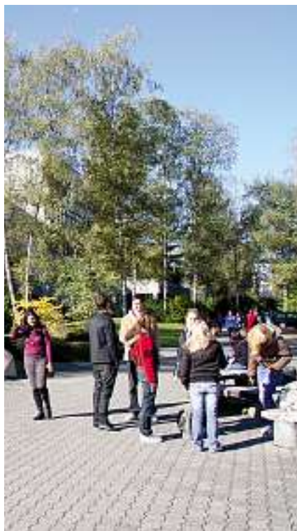
28 Aus zwei mach eins: Neue Kantonsschule Zürich Nord.