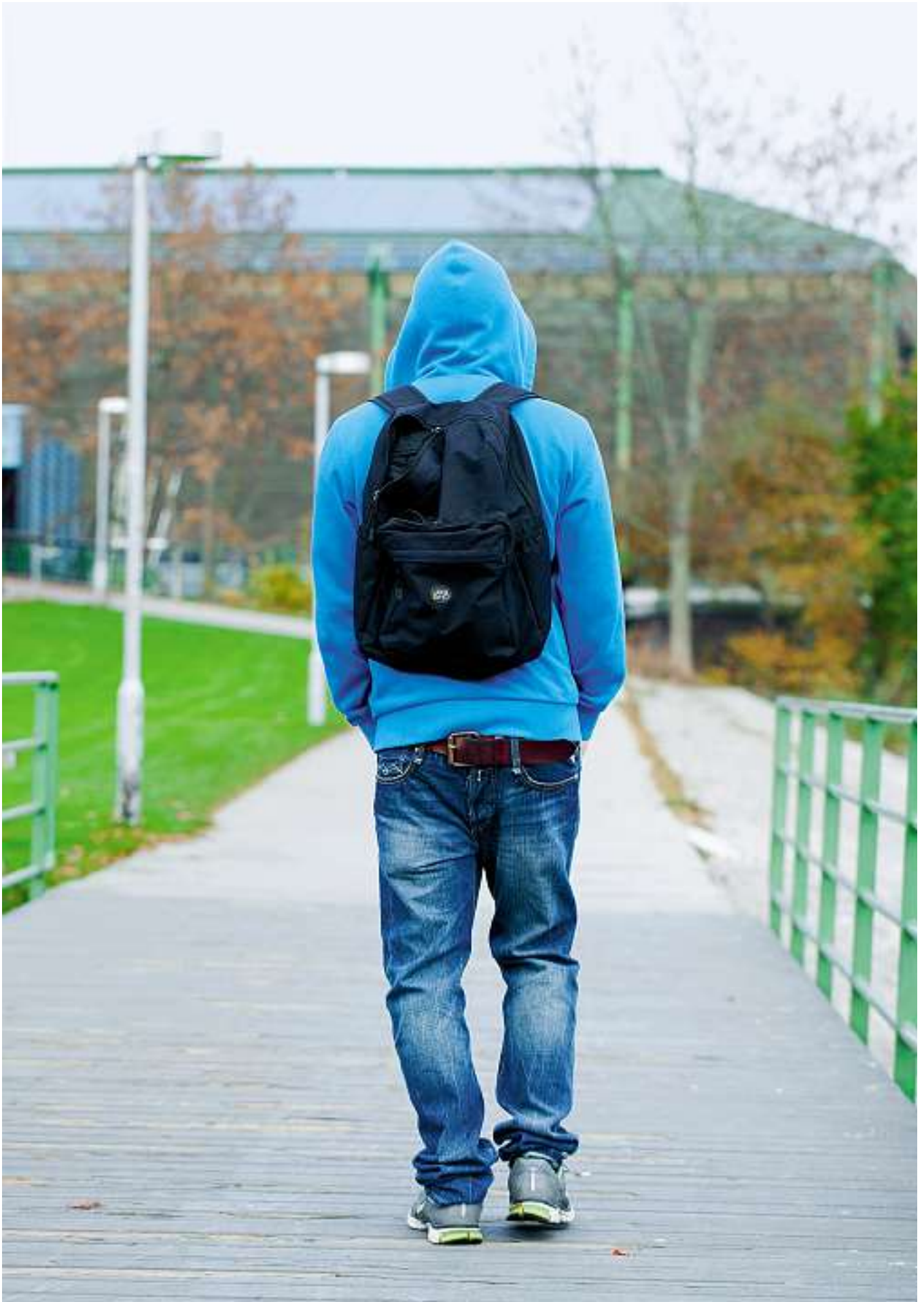
Der erste Fehler kann schon passieren, bevor die Schule beginnt.