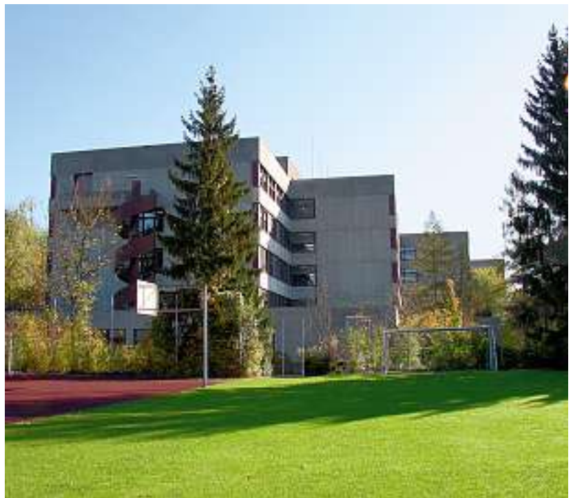
In Oerlikon wird mit Hochdruck an der neuen Kantonsschule Zürich Nord gearbeitet.

Ein Häkchen setzen kann Felix Angst im Moment erst hinter den letzten Punkt, dafür gleich ein doppeltes: Der Antrag ist erfolgt und der Bildungsrat hat ihn inzwischen gutgeheissen. Damit würde die Kantonsschule Zürich Nord als grösste Mittelschule des Kantons mit einem umfassenden Angebot aufwarten: einem Lang- und einem Kurzgymnasium mit sämtlichen Profilen und der Möglichkeit zur zweisprachigen Matur in Deutsch-Englisch und in Deutsch-Französisch sowie mit einer Fachmittelschule (FMS). Die wichtigste Hürde auf dem Weg dorthin ist aber noch der Entscheid des Kantonsrats über die Zusammenführung, der in der ersten Jahreshälfte fallen soll. Auf Hochtouren wird inzwischen auf den angestrebten Start im Sommer