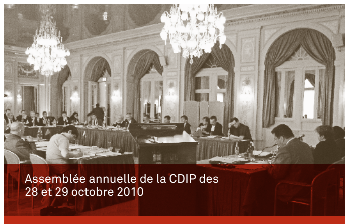
Assemblée annuelle de la CDIP des 28 et 29 octobre 2010

Voici les principaux thèmes et décisions de l'assemblée annuelle des 28 et 29 octobre 2010 ainsi que ceux de la séance du Comité de la CDIP du 28 octobre 2010.