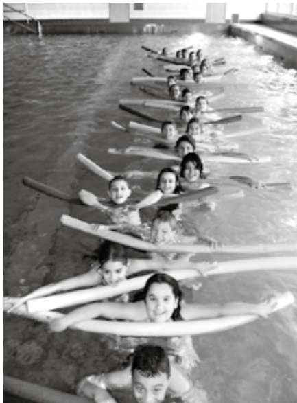
Gewinnerinnen und Gewinner der Kategorie 1.

Am 25. Juni wurden die Gewinnerinnen und Gewinner des Wettbewerbs «Das originellste Klassenfoto 2010» im Amphitheater von Windisch prämiert. In zwei Kategorien (Kategorie 1: Kindergarten bis vierte Primar; Kategorie 2: