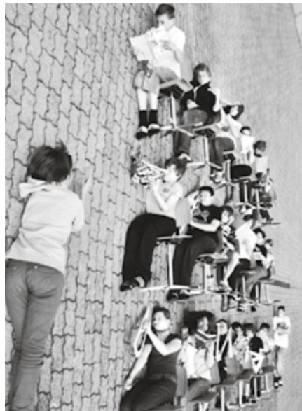
Gewinnerinnen und Gewinner der Kategorie 2.

fünfte Primar und Oberstufe) wurden die besten Beiträge erkoren. Die Bewertung der Bilder nahm eine Jury aus Kunst-, Kultur- und Bildungsspezialistinnen und -spezialisten vor.