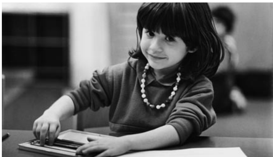
Bereits heute besuchen rund 95 Prozent der Kinder den Kindergarten.

Zwei Jahre Kindergarten, sechs Jahre Primarschule und drei Jahre Oberstufe. So soll gemäss Regierungsrat die obligatorische Volksschule ab dem Schuljahr 2013/14 aussehen. So steht es im Vernehmlassungsbericht «Stärkung der Volksschule Aargau».