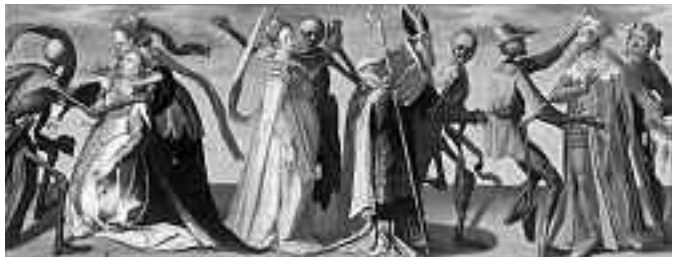
Totentanz von Jakob von Wyl

schen Gedächtnisses einer Gesellschaft. Sie geben Kunde über den Umgang mit dem Tod, über Bestattungs- und Trauerriten. Der Friedhof im Friedental wurde 1884/85 weit ausserhalb der Wohnbebauung als städtischer Zentralfriedhof angelegt. Im Friedental finden sich zahlreiche qualitätsvolle und künstlerisch gestaltete Grabdenkmäler, von historistischen Repräsentationsformen über Zeugnisse des Jugendstils und des Expressionismus sowie die in den 1920er-Jahren einsetzenden Reformbestrebungen bis hin zu aktuellen Tendenzen.