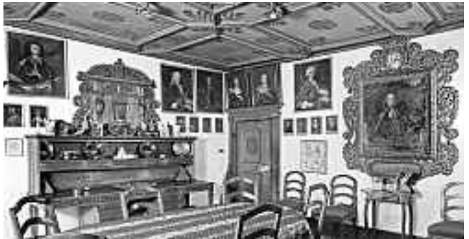
Salon Schloss Kastelen