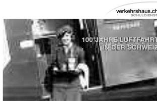
Poster-Quiz für Schülerinnen und Schüler: Schweizer Luftfahrtpioniere im Verkehrshaus entdecken und einen Schnupperflug gewinnen. Unterrichtsmaterial unter www.verkehrshaus.ch/schulzimmer

Auf spielerische Art lernen die Schülerinnen und Schüler 12 Schweizer Luftfahrtpionierinnen und -pioniere der Vergangenheit und Gegenwart kennen. Der roten Timeline in der Halle Luft- und Raumfahrt entlang ist jeder Persönlichkeit ein kleines weisses Möbel mit einem Schatzkästchen gewidmet. Darin entdeckt man einen persönlichen Gegenstand und erfährt etwas über die Pioniertat der Person. Ihre Kurzbiografie vermittelt die