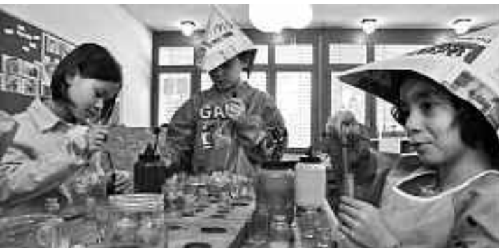
Basisstufe Rüeggisingen, Emmen