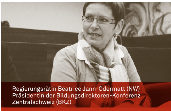
Regierungsrätin Beatrice Jann-Odermatt (NW) Präsidentin der Bildungsdirektoren-Konferenz Zentralschweiz (BKZ)

Die Bildungsdirektoren-Konferenz Zentralschweiz (BKZ) hat im März 2007 bei der EDK eine Eingabe zur Harmonisierung der Lehrdiplom-Kategorien für die Vorschul- und Primarschulstufe gemacht. Ausgangspunkt bildete die Feststellung, dass die Pädagogischen Hochschulen (PH) heute unterschiedliche Lehrdiplome abgeben. Lehrdiplomen für den Kindergarten stehen Lehrdiplome gegenüber, die gleichzeitig für