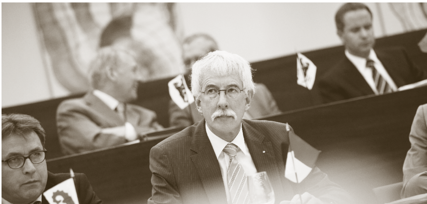
Die Plenarversammlung in Bern.

Damit soll eine weitere Vereinheitlichung bei den Ausbildungsangeboten sowie bei ergänzenden Qualifikationen erreicht werden.