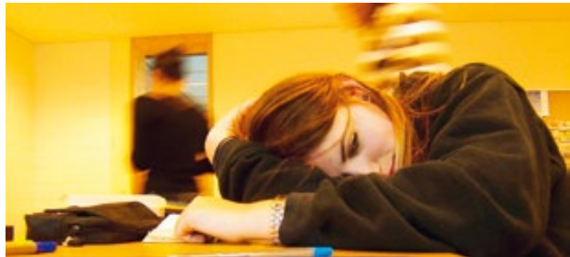
Psychische Krisen von Lernenden frühzeitig erkennen

Psychische Probleme, insbesondere depressive Verstimmungen und Suizidabsichten sind bei Jugendlichen weit verbreitet. Viele der betroffenen Jugendlichen denken sogar an einen Suizid: 18% der jungen Frauen entwickeln einen entsprechenden Handlungsplan, 7% unternehmen einen Sui-