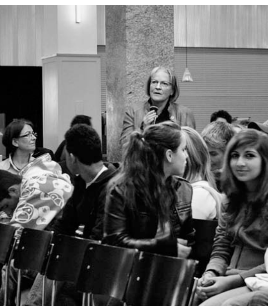
Bild von der Publikumsdiskussion anlässlich der letzten Veranstaltung von «Schule im Dialog» zum Thema «Wie wählen junge Frauen und Männer ihren Beruf?»