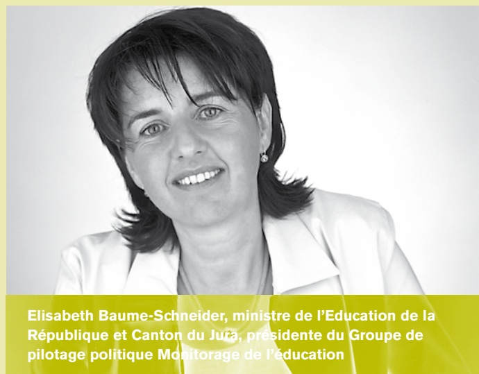
Elisabeth Baume-Schneider, ministre de l'Éducation de la République et Canton du Jura, présidente du Groupe de pilotage politique Monitoring de l'éducation

tique, celle des responsables du système éducatif suisse. C'est à partir de ce rapport que, dans ces prochains mois, la CDIP et la Confédération vont poursuivre leur collaboration: il s'agira en particulier de statuer sur l'organisation définitive du monitoring,